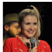
Open Mic POTRVÁ #71 (II) 7. 2. 2014