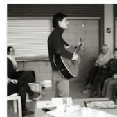
Open Mic & Praha 6 | 2014