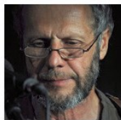
Open Mic POTRVÁ #73 (II)